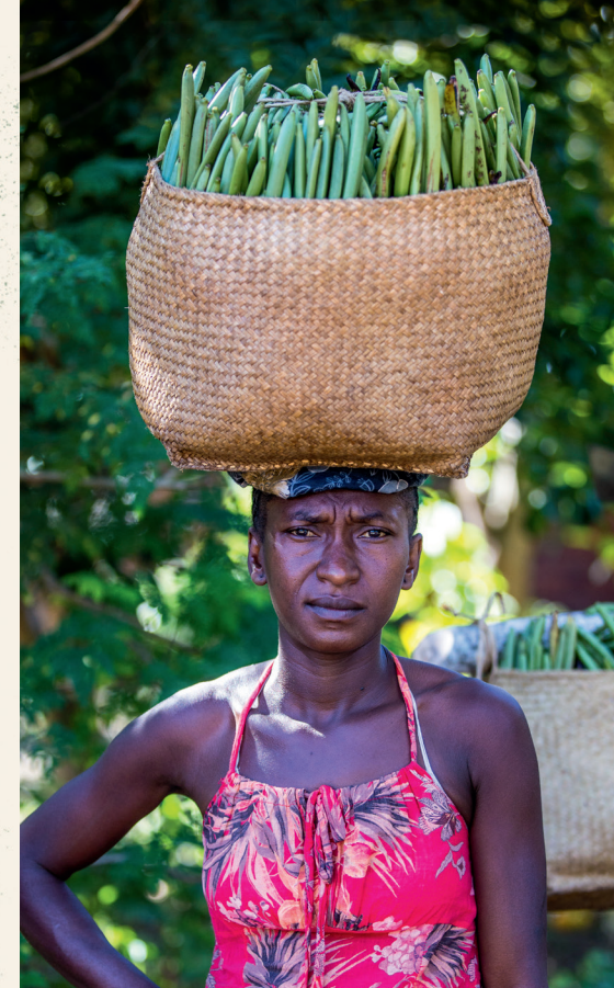
Uma família malagaxe fatura, em média, R$ 125 por mês produzindo baunilha.

Alguns produtores organizam milícias para vigiar os cultivos noite e dia. E, pra variar, quem mais sofre com a violência são os menores produtores, sem →